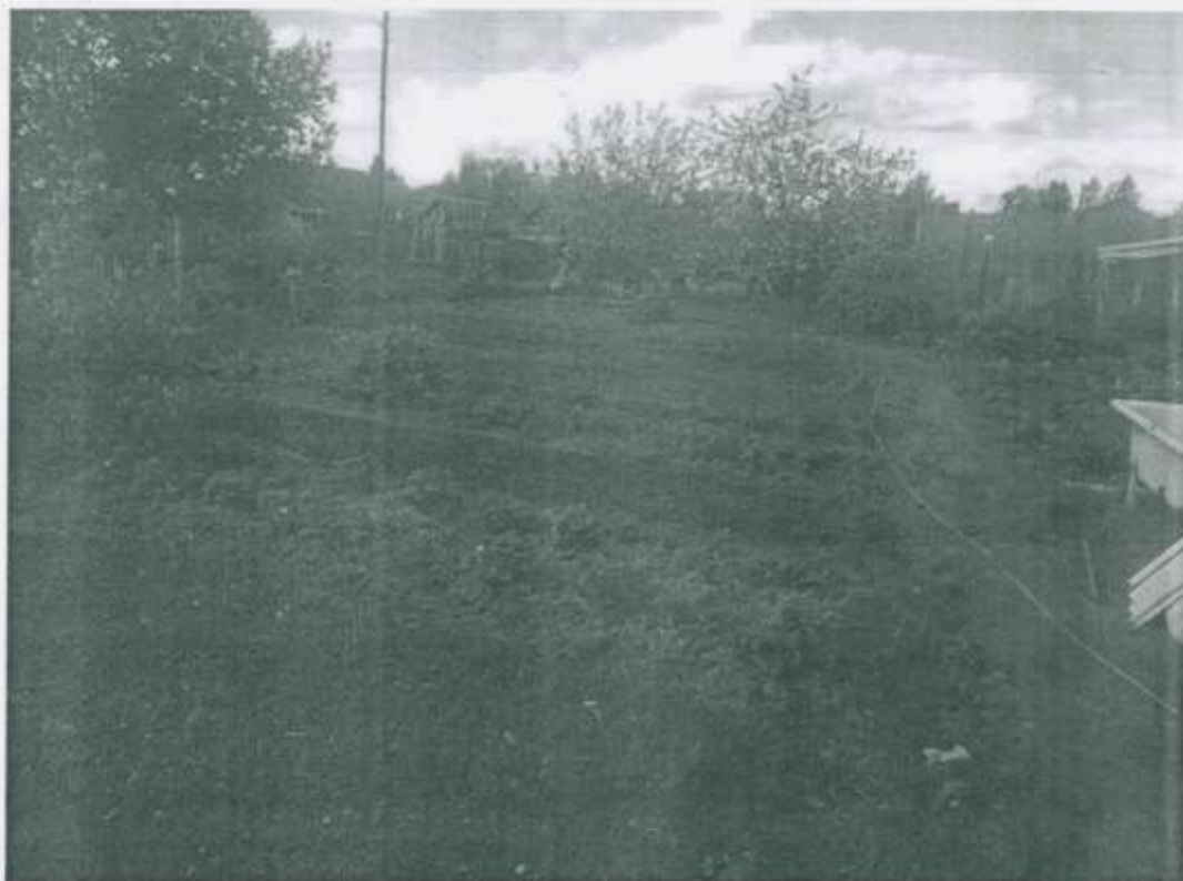
ФОТО № 1

Российская Федерация, Московская область, городской округ Лотошино, д.Введенское (адрес земельного участка)